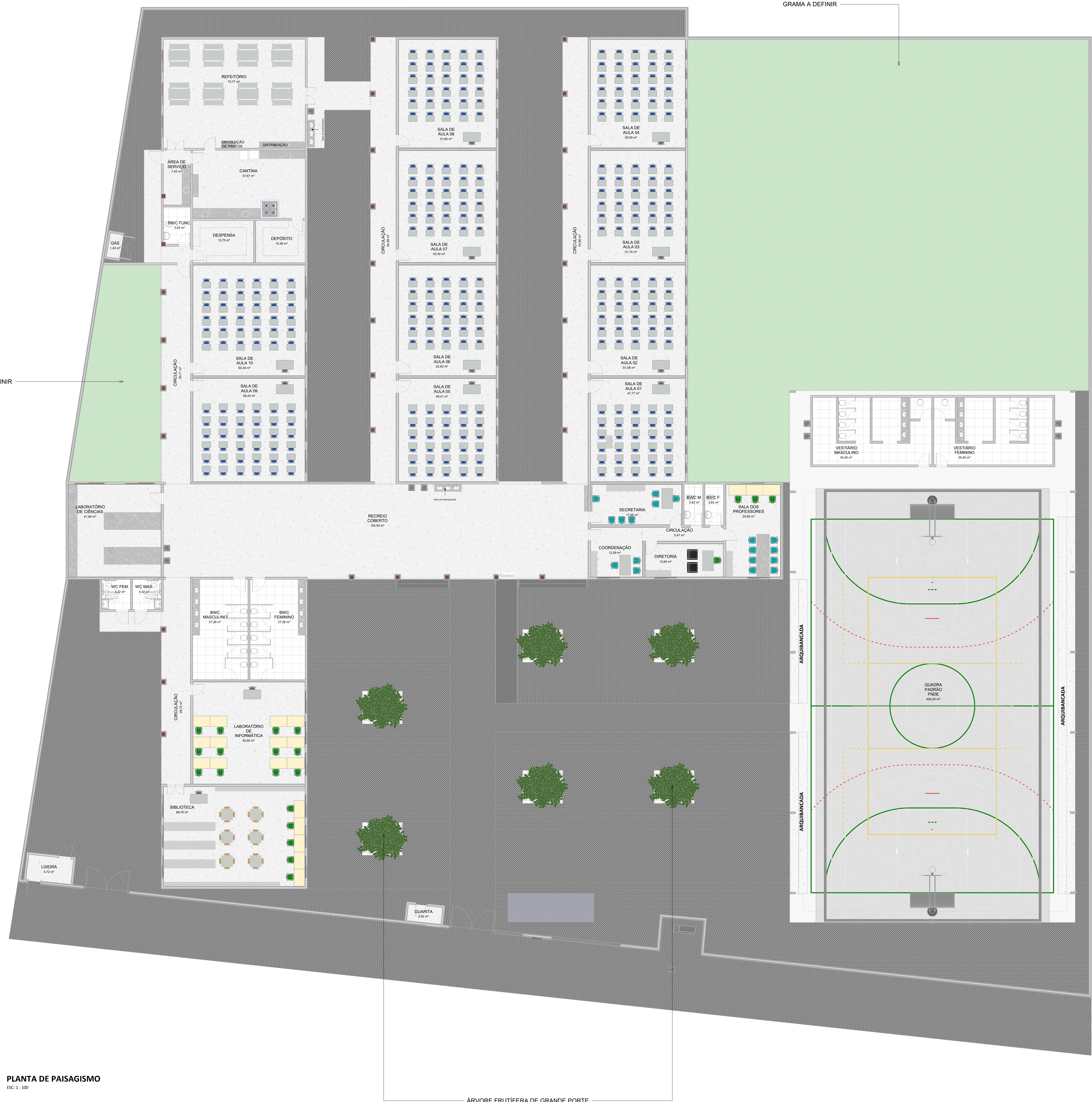
PLANTA DE PAISAGISMO ESC: 1:100